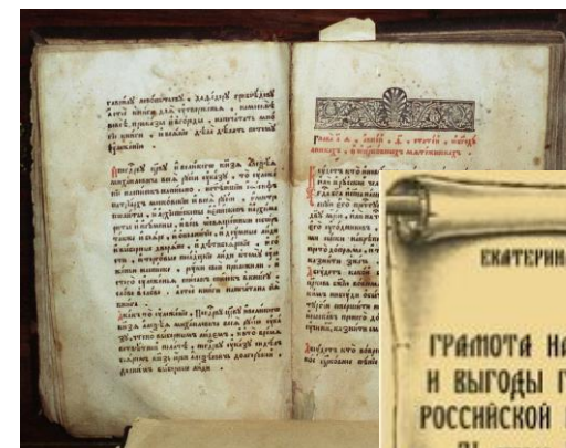
Соборное уложение 1649 г.

Основные акты конституционного значения, 1600–1918 гг.