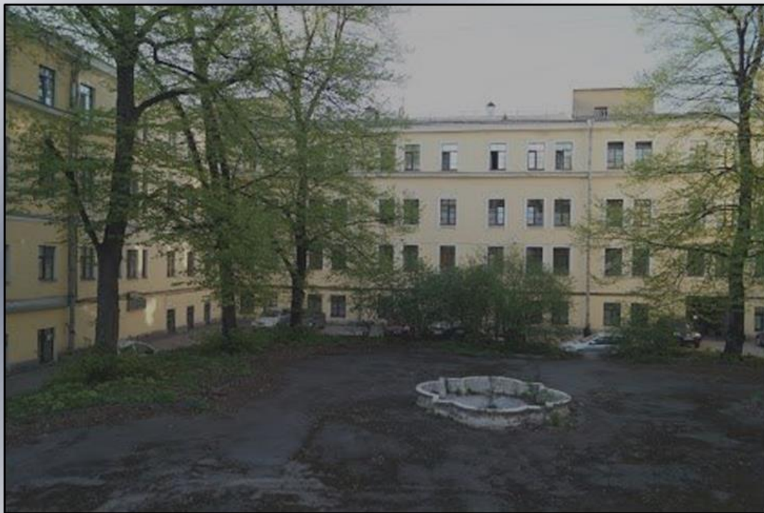
Санкт-Петербургская городская коллегия адвокатов