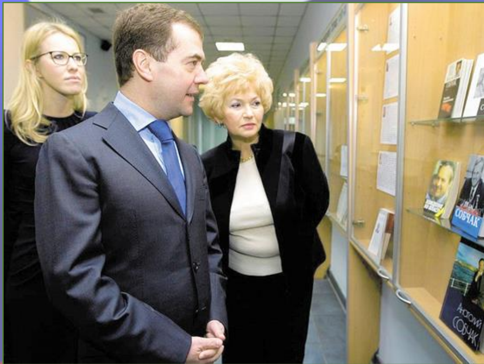
Президент РФ Дмитрий Медведев, члены семьи А.А. Собчака Людмила Нарусова и Ксения Собчак знакомятся с выставкой, посвященной первому мэру Санкт-Петербурга. 2010 год.

«Он был настоящий юрист, практикующий в политике. Вот это для меня самое важное. Он не был фантастическим организатором. Он был в большой степени трибун, блестящий полемист. Думаю, что в определенной ситуации он, конечно, мог бы стать великолепным председателем парламента, но жизнь так не сложилась. Наоборот, ему пришлось заниматься самым трудным – вытаскиванием хозяйства и социальной сферы Ленинграда – Петербурга в самый тяжелейший, просто критический период».