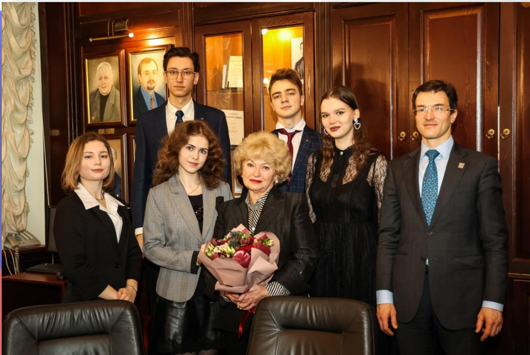
На церемонии вручения именных стипендий. 22 февраля 2022 г.