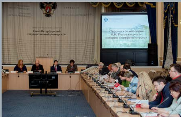
Первый день конференции. СПбГУ. 14.12.2017