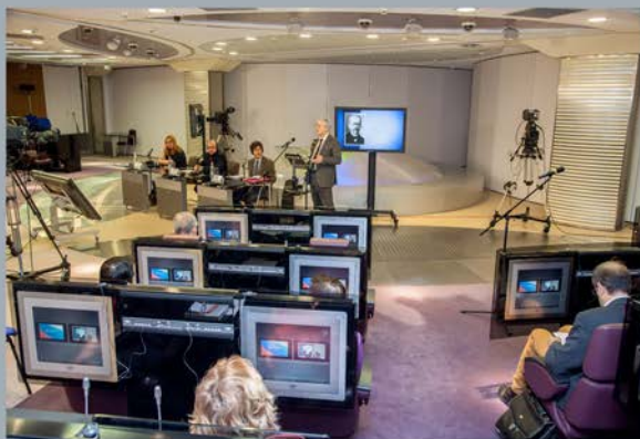
Второй день конференции. Президентская библиотека. 15.12.2017