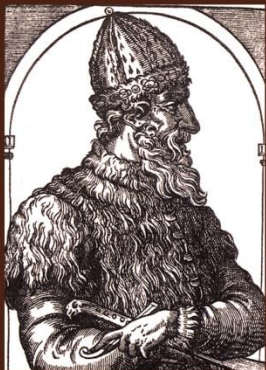
ИВАН III ВАСИЛЬЕВИЧ, ВЕЛИКИЙ КНЯЗЬ МОСКОВСКИЙ.