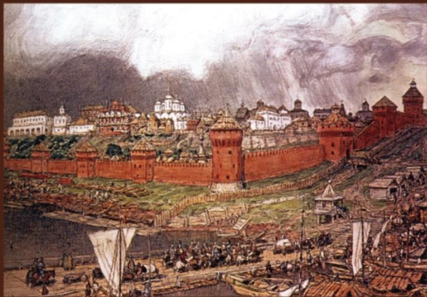
Московский Кремль при Иване III. А. Васнецов