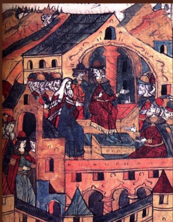
Заседание Боярской Думы. 1541 год. Миниатюра Лицевого летописного свода. XVI век.

По Судебнику 1497 г. суд не был отделен от административного аппарата. Существовали три судебные ветви: государственная, вотчинная (местная), церковная. Судебными полномочиями были наделены великий князь, Боярская дума, приказы, наместники и др. В процессе участвовали окольниковые, дьяки, тиуны, приставы. Появилась должность недельщика, в обязанность которого входили вызов в суд сторон, арест и пытка обвиняемых, передача в суд дел о воровстве, организация судебного поединка и исполнение решения суда. Взятки и иные вмешательства в дела суда категорически запрещались.